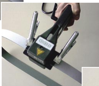
PRESSATURA A CALDO