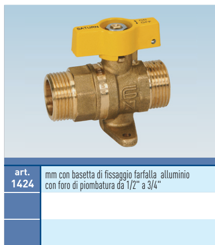
art. 1424 mm con basetta di fissaggio farfalla alluminio con foro di piombatura da 1/2" a 3/4"