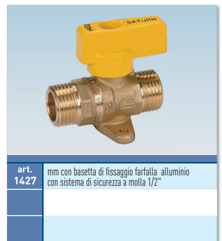
art. 1427 mm con basetta di fissaggio farfalla alluminio con sistema di sicurezza a molla 1/2"